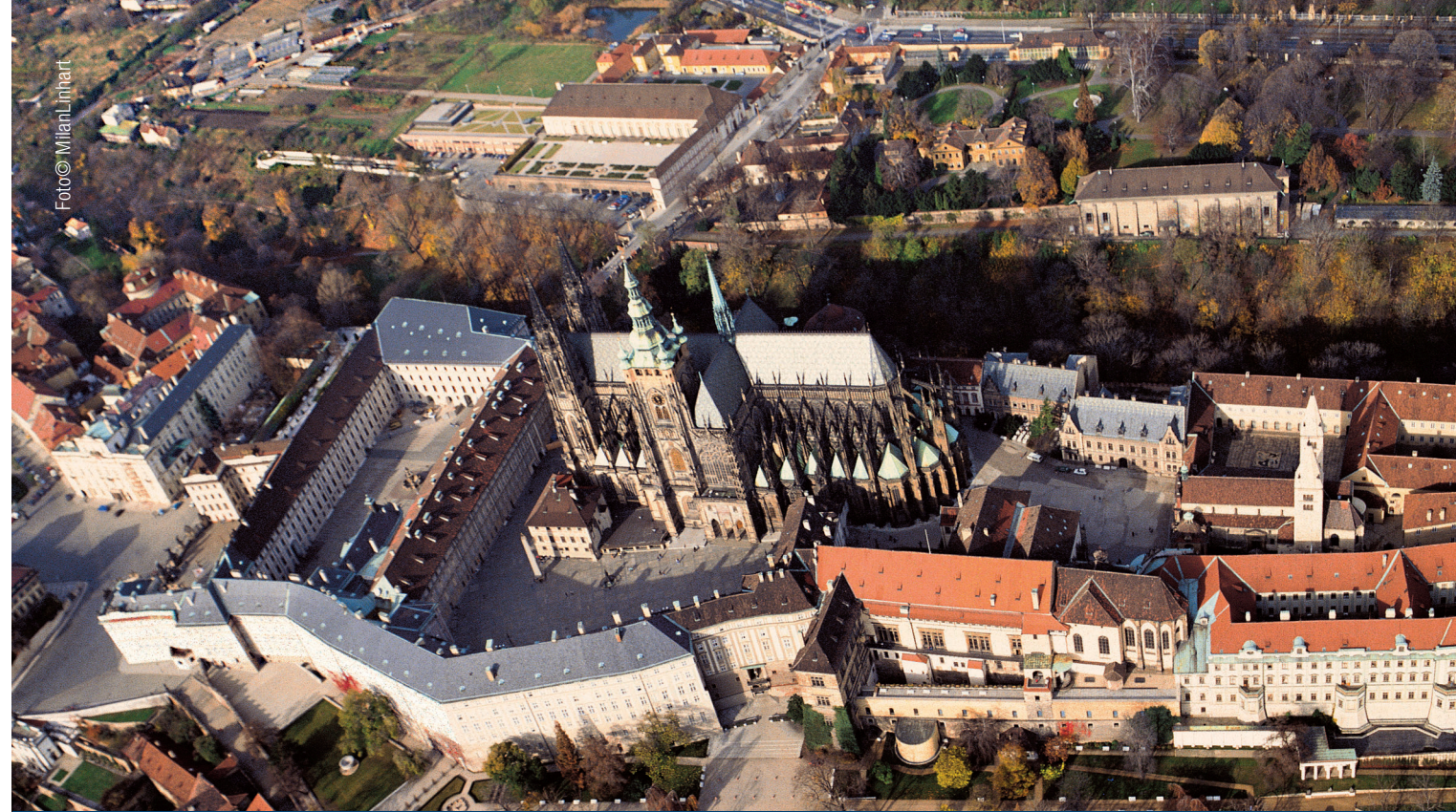
Obrazárna Pražského hradu Prague Castle Picture Gallery