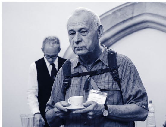
Konference Relativity and Gravitation – 100 Years after Einstein in Prague v Karolinu, červen 2012.

Zakrátko – bylo mu právě 80 – si na hudebním serveru SoundCloud zřídil účet, „olajkoval“ a sdílel mi