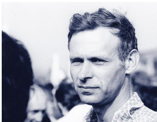
První máj na Letné roku 1980.

V těch posledních desetiletích jsem se s Jirkou vídával nejčastěji na teoretické fyzice v Troji, ale i na „machovských“ symposiích organizovaných v Brně nebo na vědeckých radách Slezské univerzity v Opavě, kde vždy výrazně přispíval k programu. Nejhezčí vzpomínky ale mám na čtyřdenní konferenci „Od Galilea k sou-